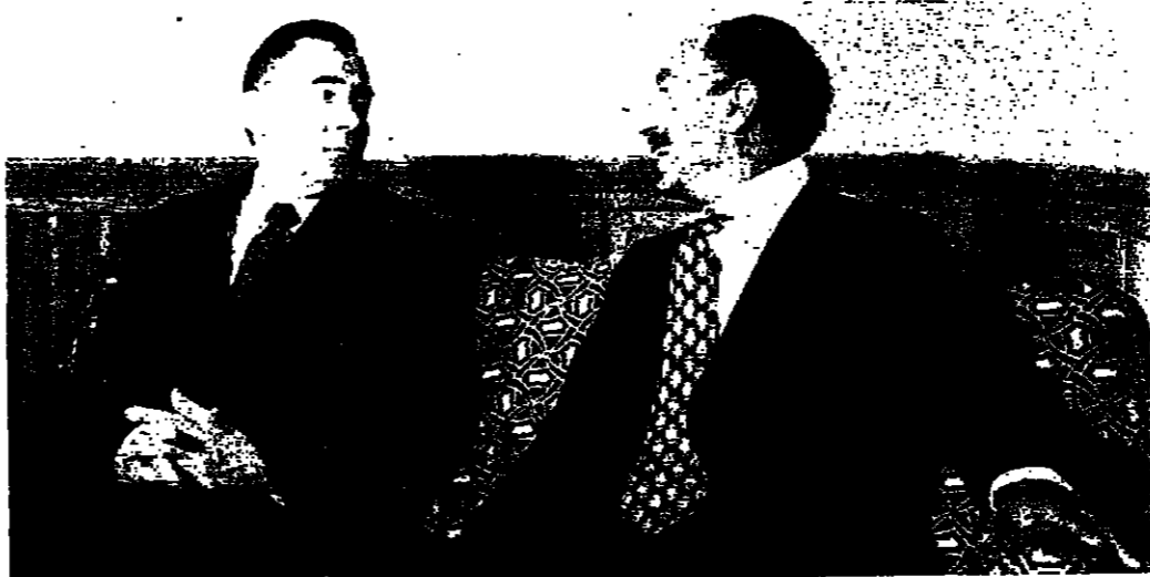
الرئيس السادات وفاروق امس (صورة من امس)

مئات الالوف يودعون ام كلثوم بالقاهرة اليوم